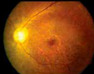
Distrofia de conos / bastones