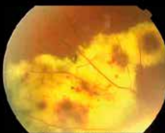
Enfermedad de Coast