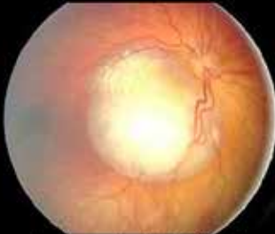
Enfermedad de Norrie