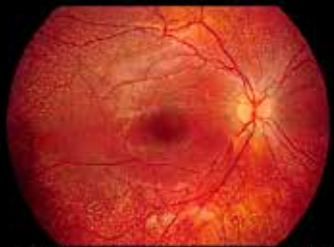
Retinitis Punctata Albecens